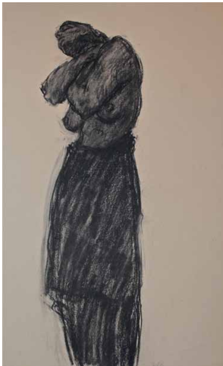
TANZEN, STUDIO N. 113, s.d. Carboncino su carta 50x60 cm.