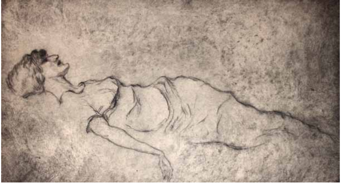
FIGURA FEMMINILE, s.d. Puntasecca 30x17 cm.