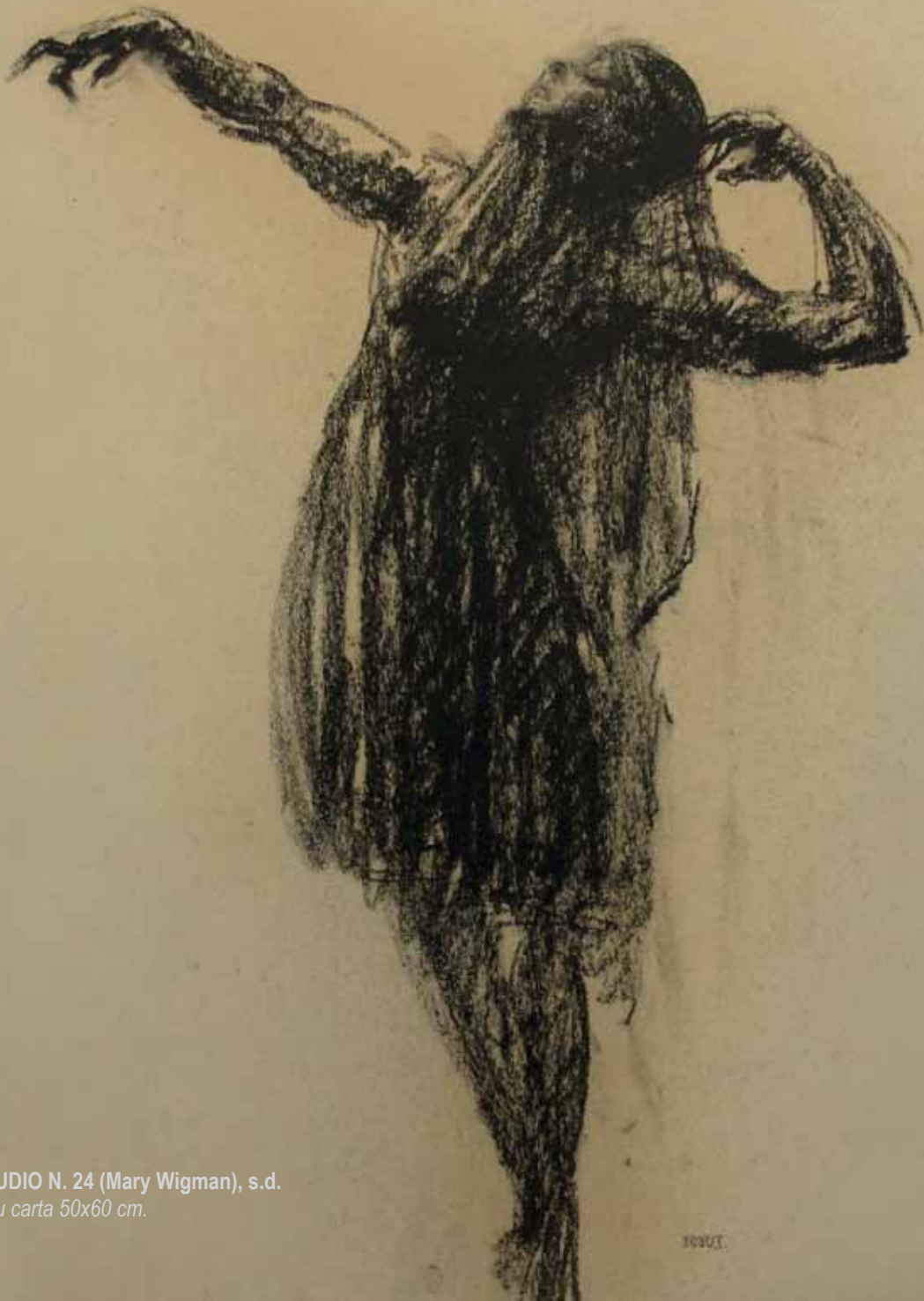
TANZEN, STUDIO N. 24 (Mary Wigman), s.d. Carboncino su carta 50x60 cm.