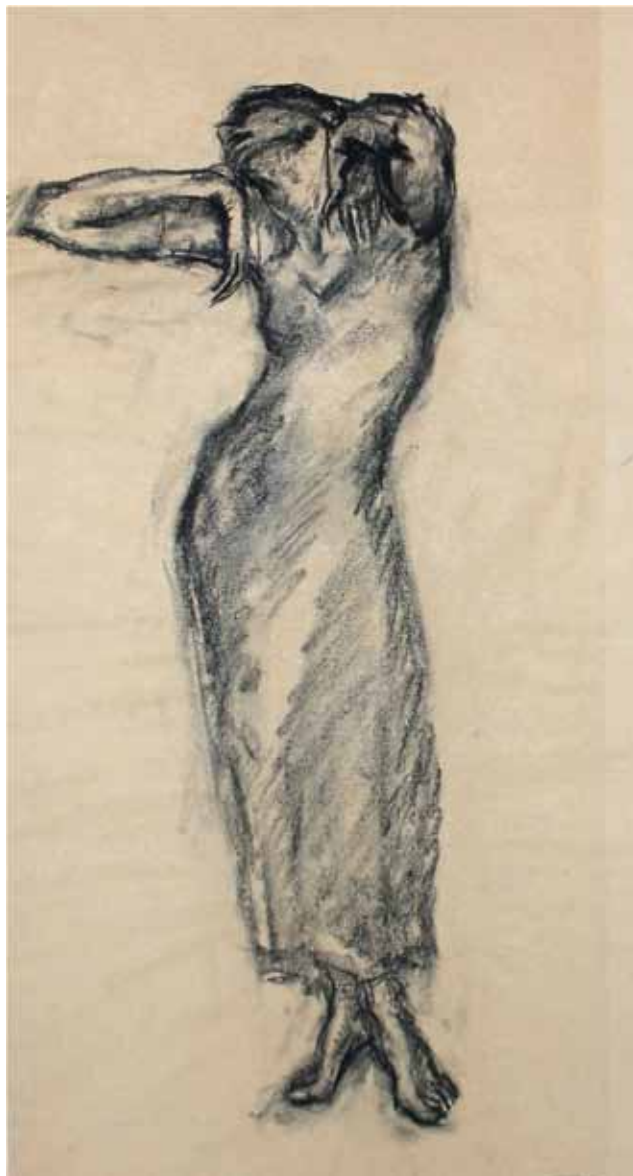
TANZEN, STUDIO N. 131, s.d. Carboncino su carta 40x65 cm.