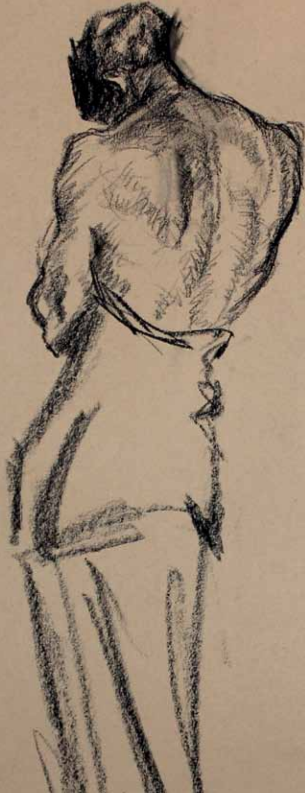
TANZEN, STUDIO N. 95, s.d. Carboncino su carta 50x60 cm, dettaglio.