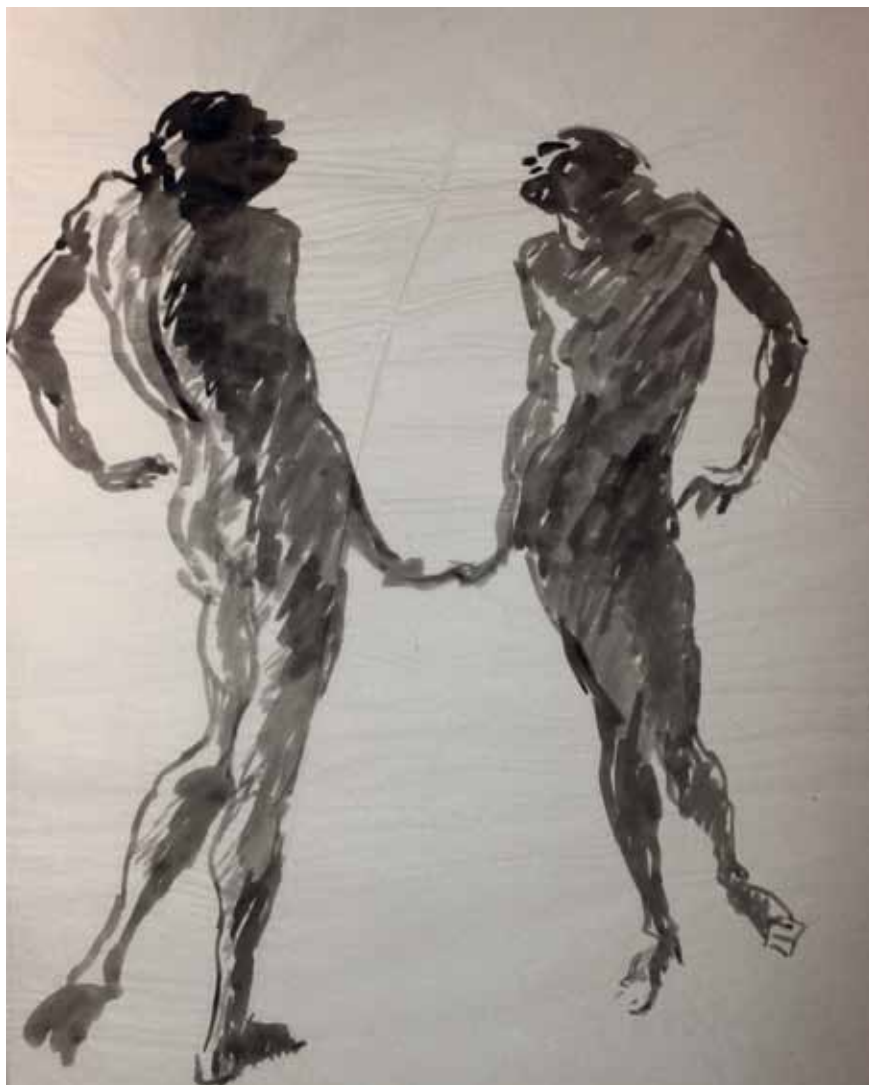
TANZEN, STUDIO N. 58, s.d. Acquarello su carta 50x60 cm.