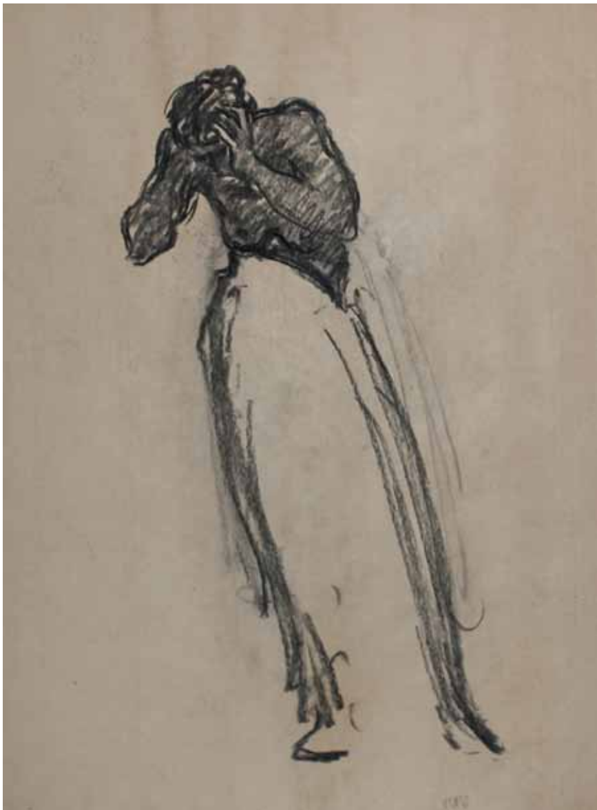
TANZEN, STUDIO N. 155, s.d. Carboncino su carta 45x60 cm.