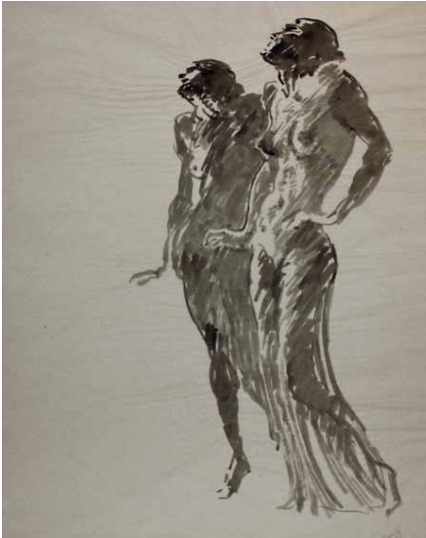
TANZEN, STUDIO N.83, s.d. Acquarello su carta 50 x 60 cm.