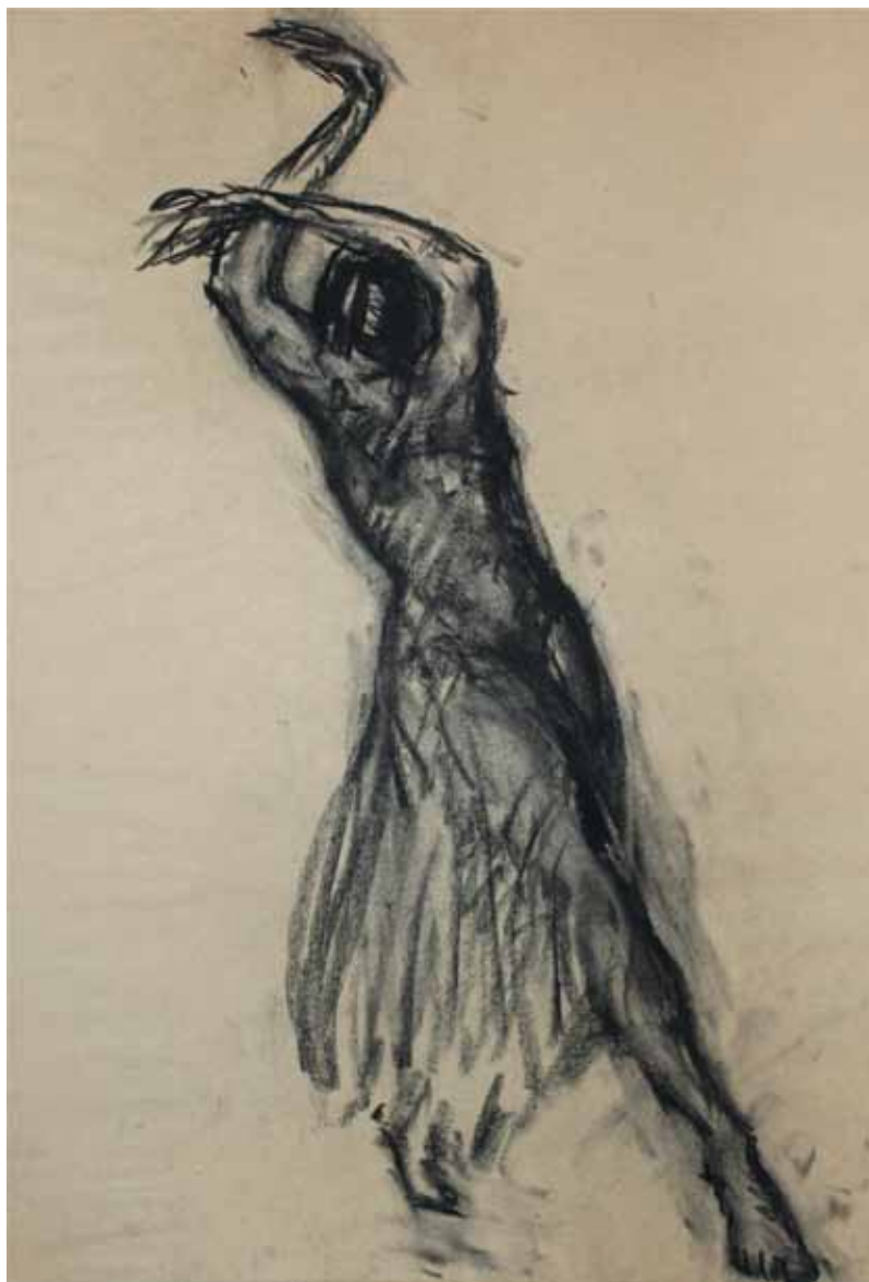
TANZEN, STUDIO N. 147, s.d. Carboncino su carta 40x55 cm.