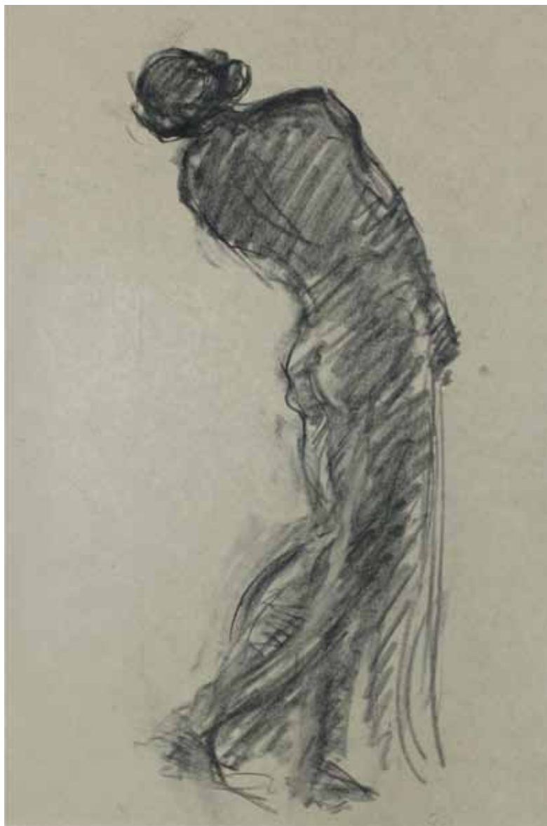
TANZEN, STUDIO N. 153, s.d. Carboncino su carta 34x45 cm.