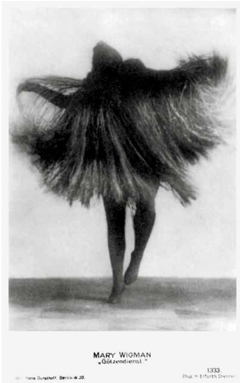
MARY WIGMAN, POSTCARD BY HUGO ERFURTH, DRESDA 1918/19 "Dada global", Kunsthau Zürich und Limmat Verlag 1994, Zürich, p. 276