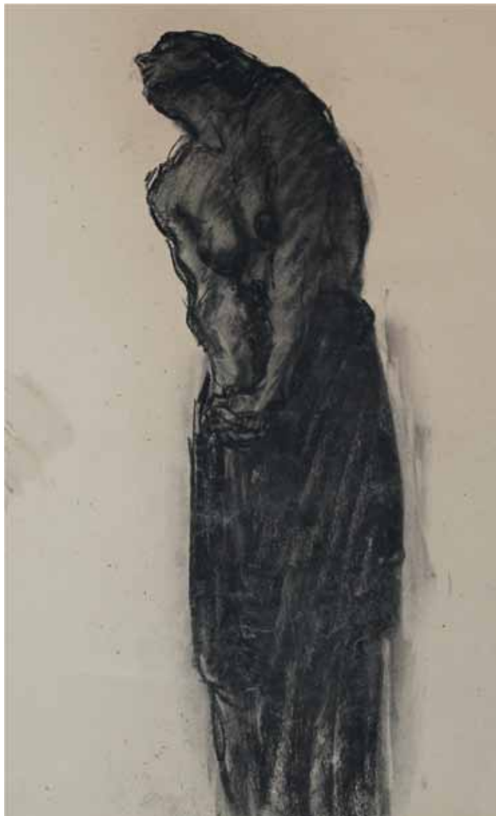
TANZEN, STUDIO N. 112, s.d. Carboncino su carta 50x60 cm.