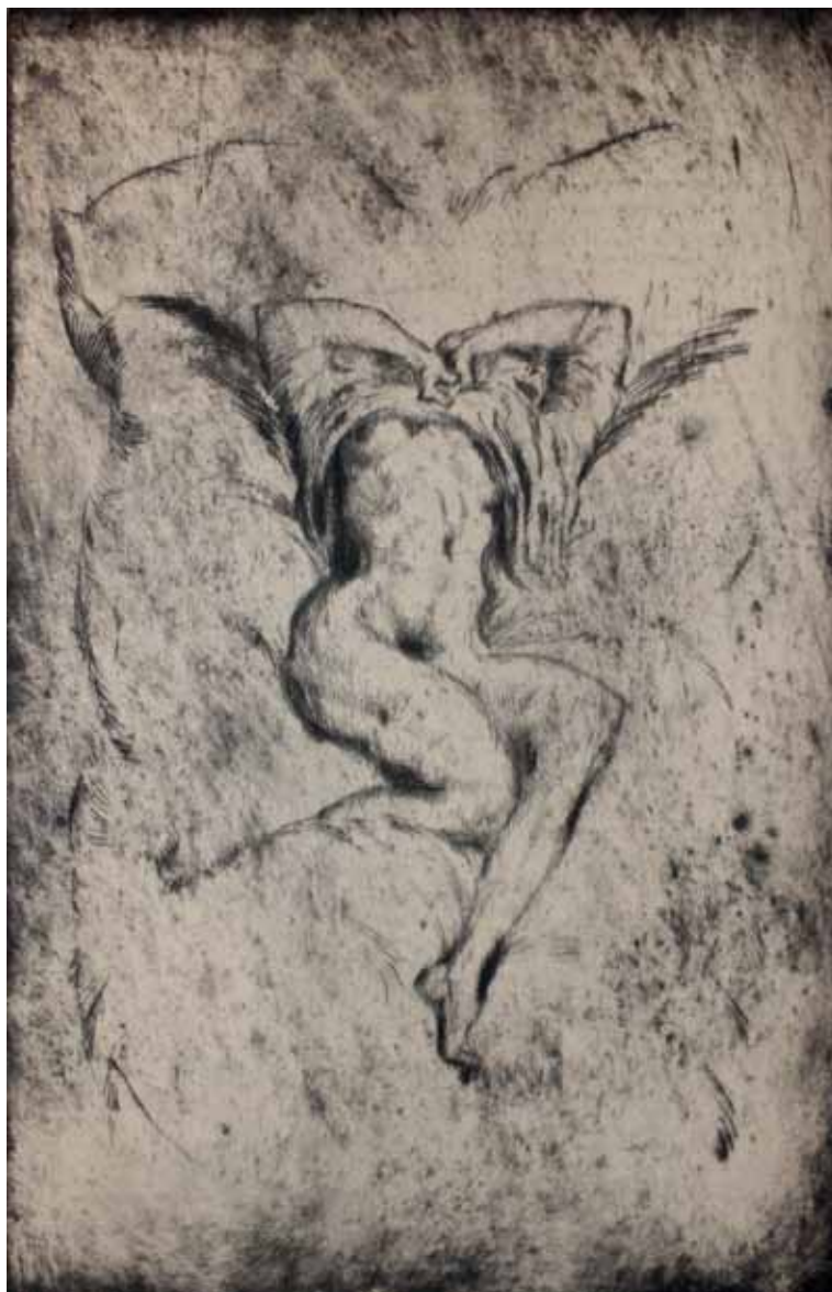
NUDO, s.d. Puntasecca 20x30,5 cm.