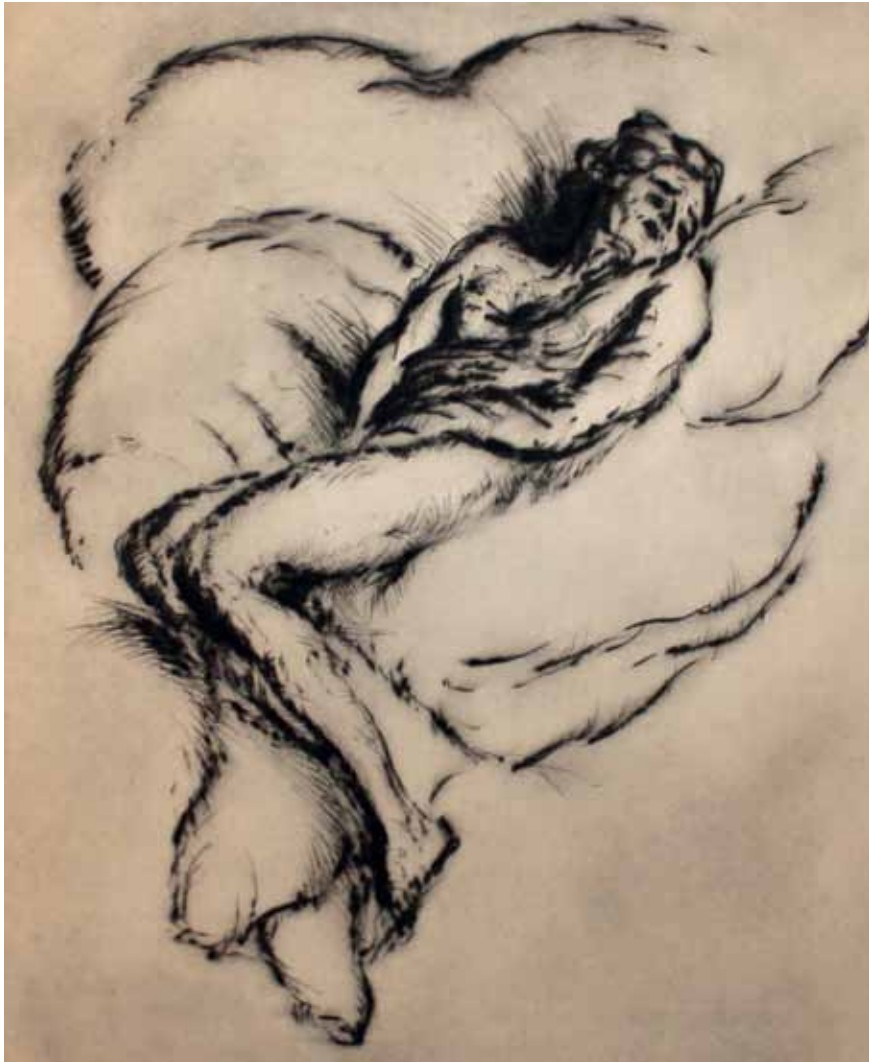
NUDO, (EMMY HENNINGS), s.d. Puntasecca 25,5x32 cm.