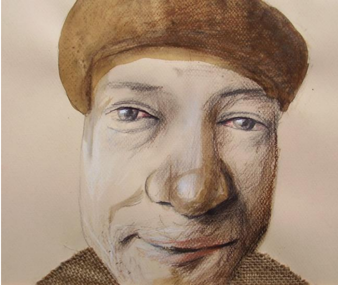
Guardami negli occhi! 2011 tecnica mista su carta 24x30 cm