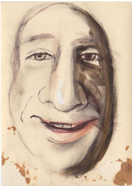
Un matto! 2011 tecnica mista su carta 18x13 cm