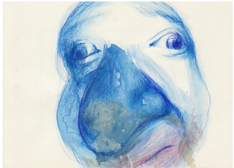
Studio di un volto! 2010 tecnica mista su carta 13x17 cm